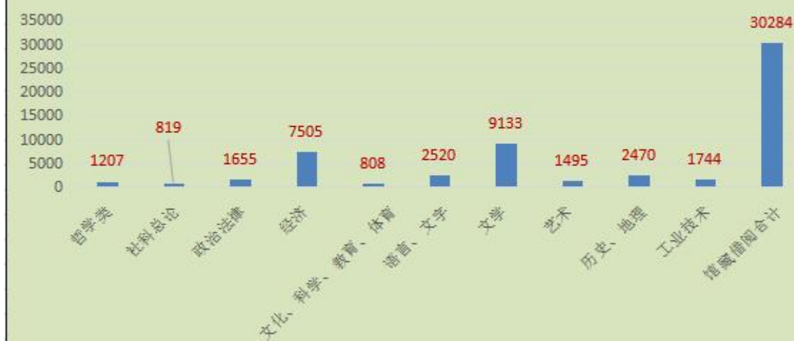
2022年度图书借阅比例：前十类